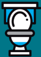
** Vasos Sanitários