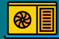
* Bandejas de Ar condicionado