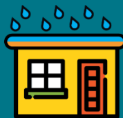
* Lajes e marquises