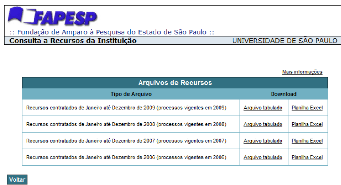
Figura 2: Listagem dos arquivos com informações dos processos

É possível realizar o download destes arquivos em dois formatos: