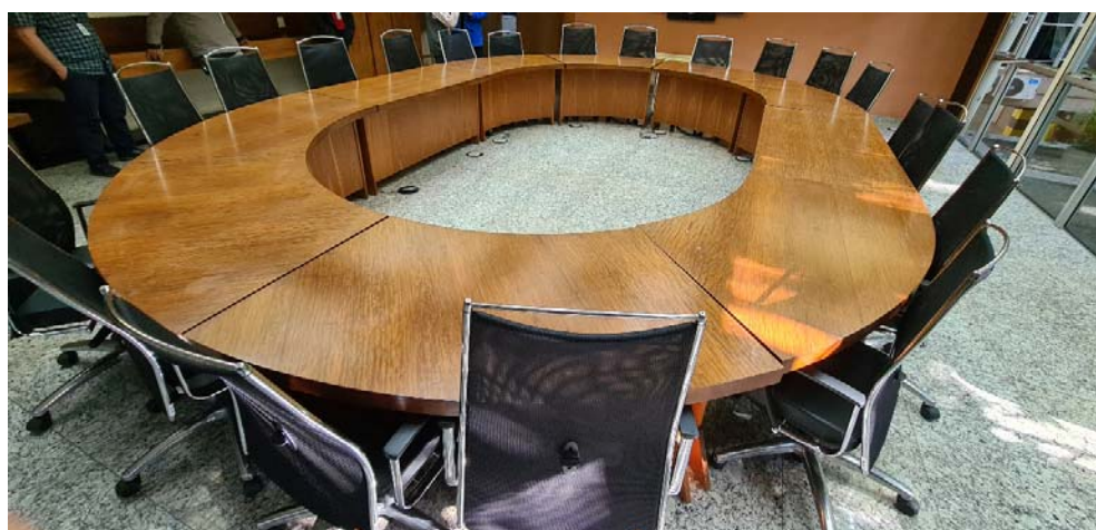
Imagem 1- Visão geral Posterior

Contratação de empresa especializada em serviços de marcenaria para execução de retrofit das 11 (onze) mesas existentes na Sala do Conselho Superior, 1º andar, conforme imagens abaixo: