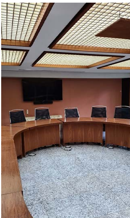
Imagem 4- Detalhe das mesas