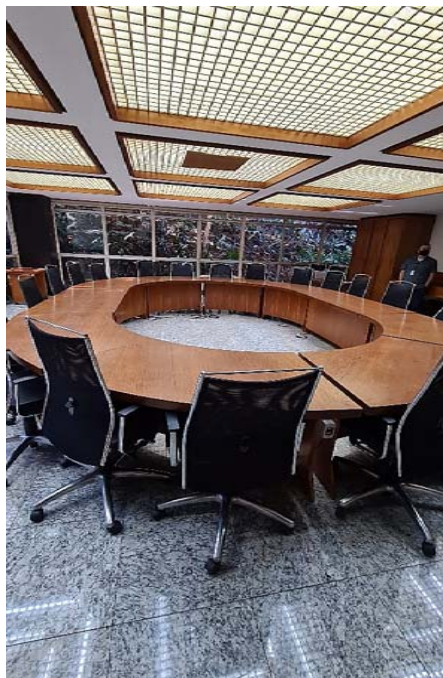
Imagem 3- Visão geral Frontal