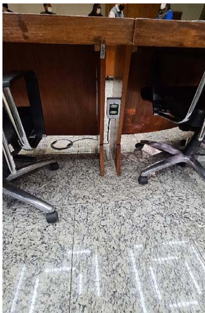
Imagem 2- Bases= Pés das mesas